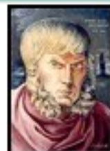
CASPAR DAVID FRIEDRICH (1774-1840)