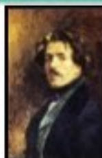
EUGÈNE DELACROIX (1798-1863)