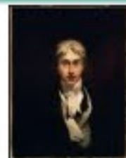
WILLIAM TURNER (1775-1851)