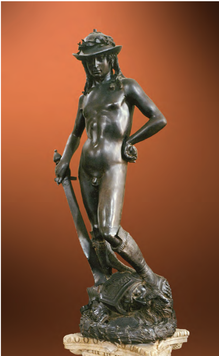
IMATGE 1 / IMAGEN 1

Imatge 1: David . Donatello. Hacia 1440.