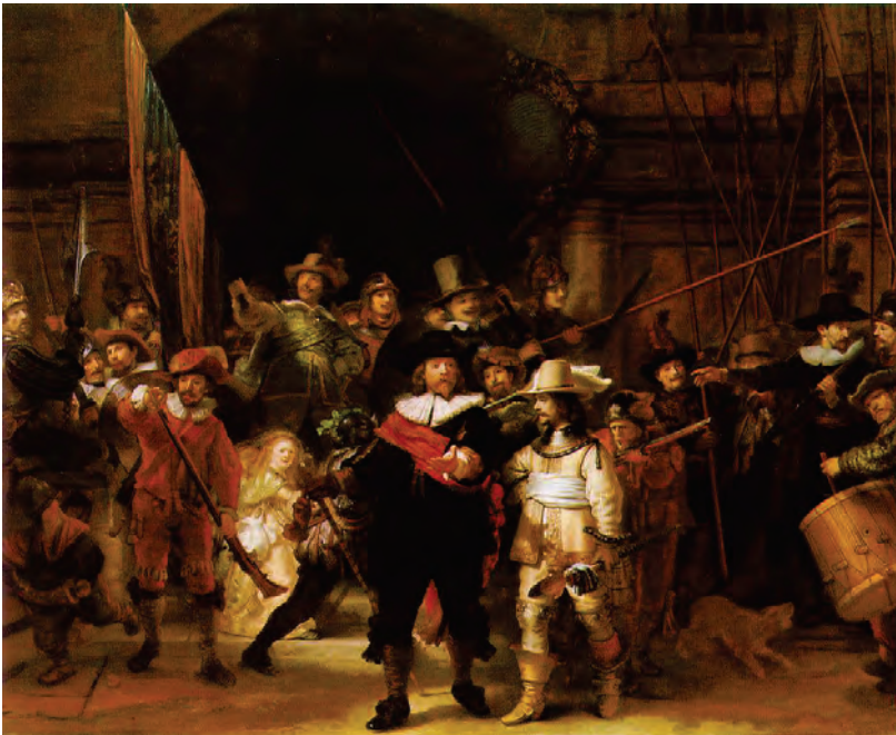
Imagen 1: La Ronda de noche . Rembrandt. 1641-1642.

Imatge 1: La Ronda de nit . Rembrandt. 1641-1642.