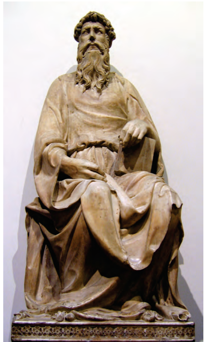
IMATGE 2 / IMAGEN 2

Imagen 1: David . Donatello. Hacia 1440.