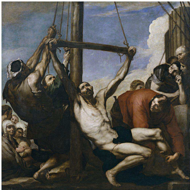
Imagen 1: Martirio de San Felipe . José de Ribera. 1639.

Imatge 1: Martiri de Sant Felip . Josep de Ribera. 1639.