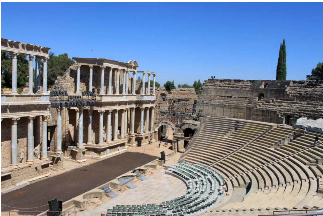
IMATGE 2 / IMAGEN 2