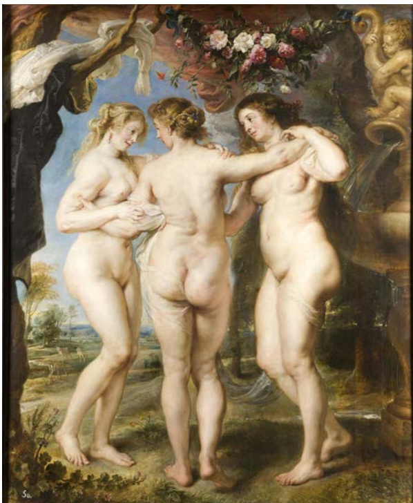
IMATGE 2 / IMAGEN 2

Imagen 1: Rubens. Adoración de los Magos. Museo Nacional del Prado, Madrid, 1609.