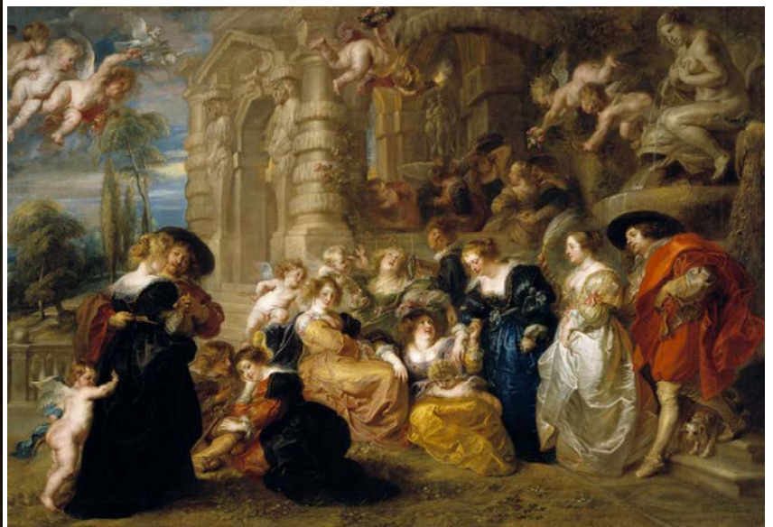
IMATGE 3 / IMAGEN 3

Imagen 2: Rubens. Las tres gracias. Museo Nacional del Prado, Madrid, 1630-1635.