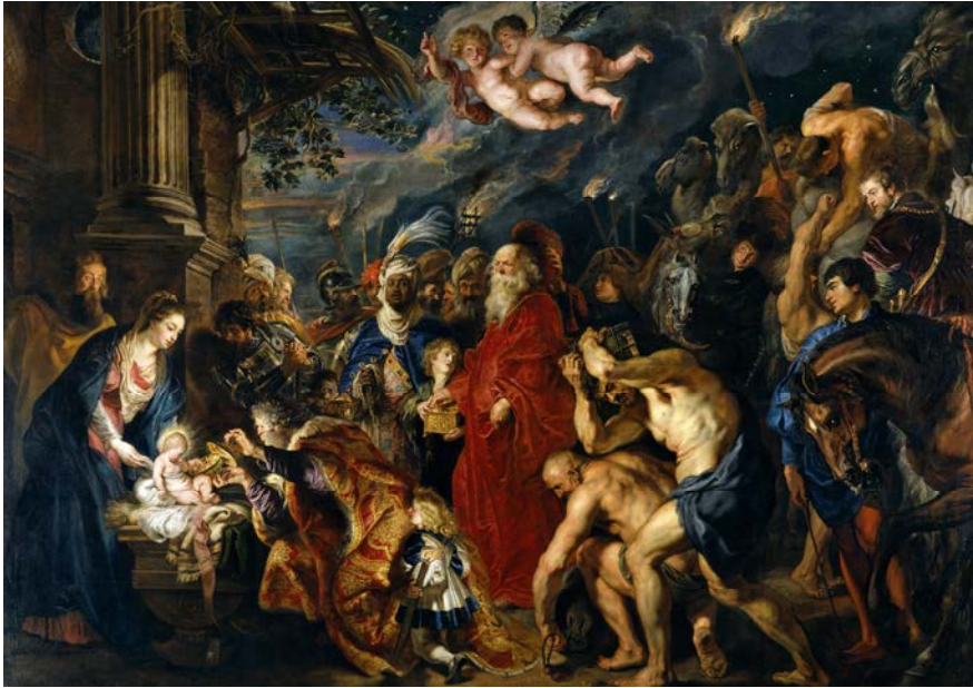
IMATGE 1 / IMAGEN 1

Imatge 1: Rubens. Adoració dels Mags. Museu Nacional del Prado, Madrid, 1609.