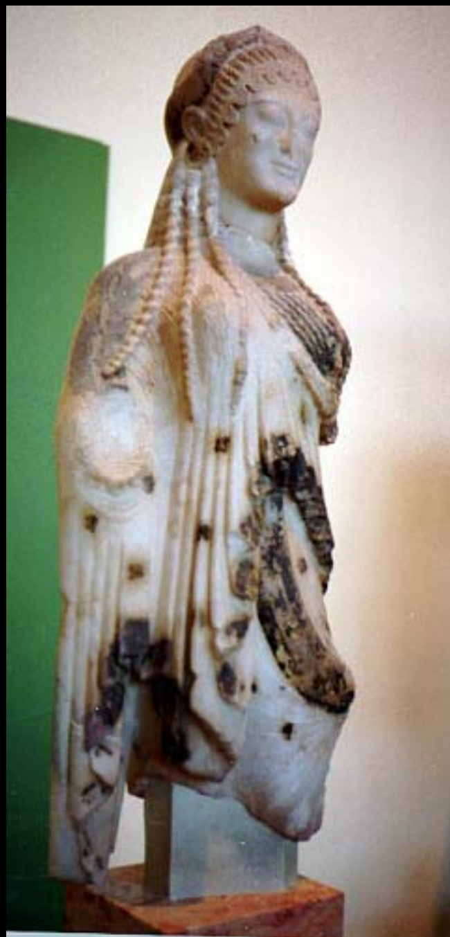
KORÉ DE KÍOS, 530 A.C. MÁRMOL POLICROMADO