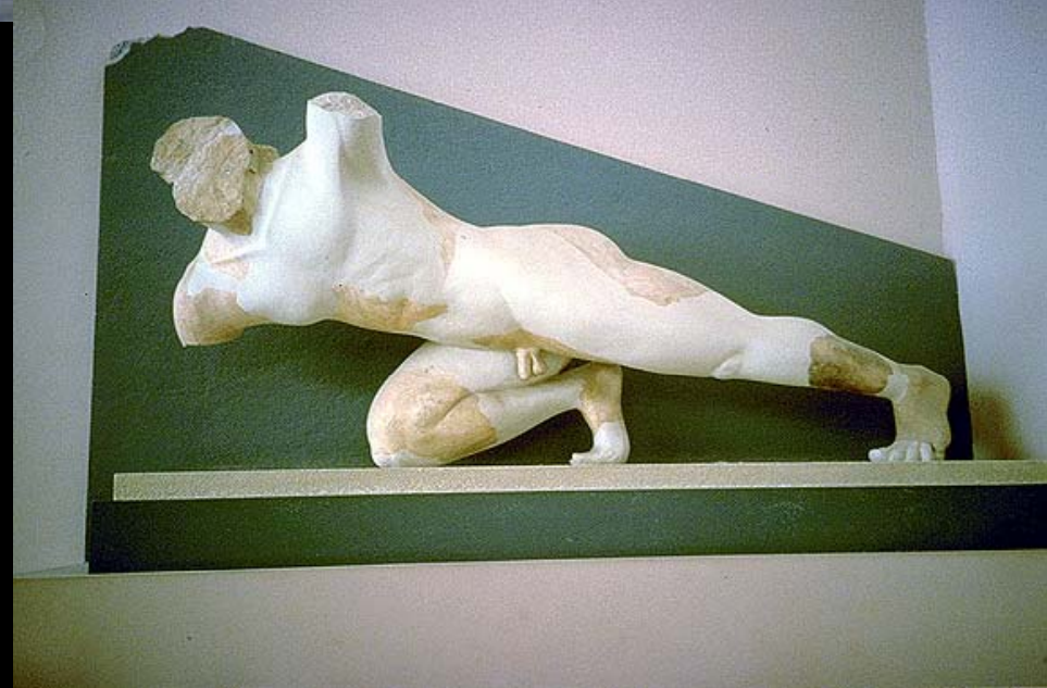
Guerreros del tímpano este, Templo de Athenea en la Acrópolis. (Atenas, Acrópolis Museum) c 520 AC) mármol de Paros