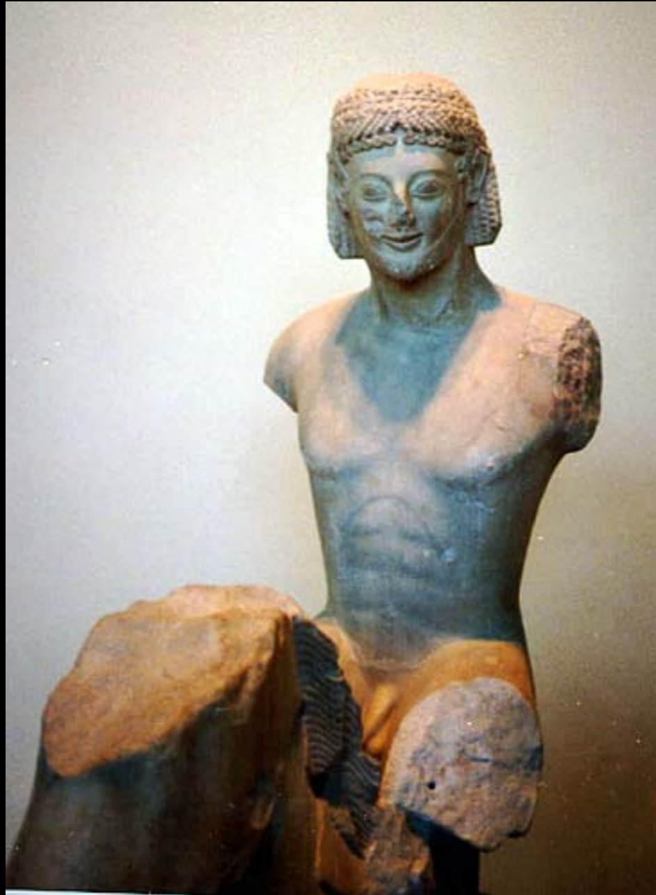
El Jinete Rampín Museo Nacional de Atenas