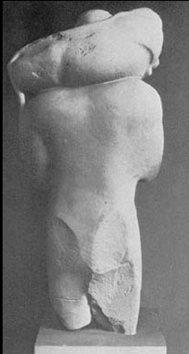
El joven del becerro (Moscóforo), Museo de la Acrópolis de Atenas, 575-550 a. C.