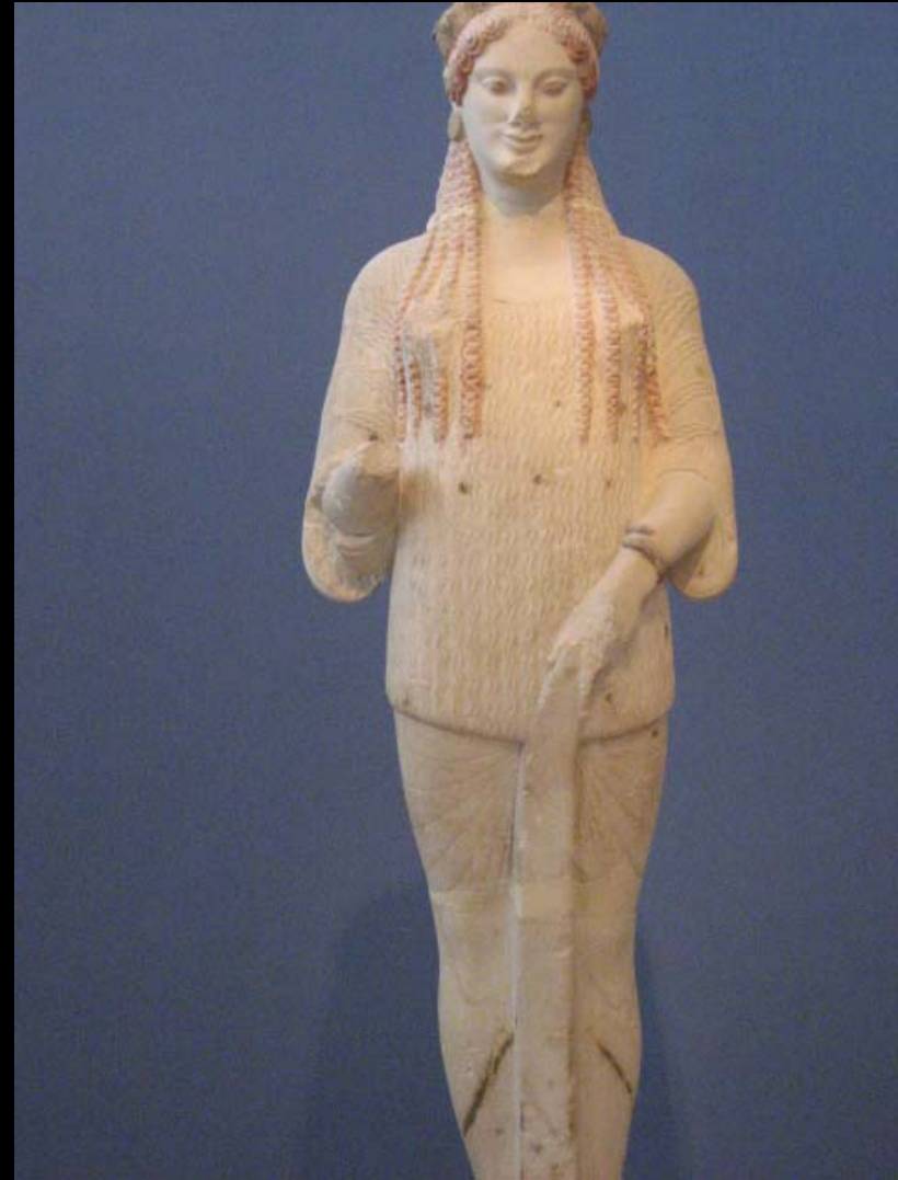
KORÉS DEL MUSEO DE LA ACRÓPOLIS DE ATENAS