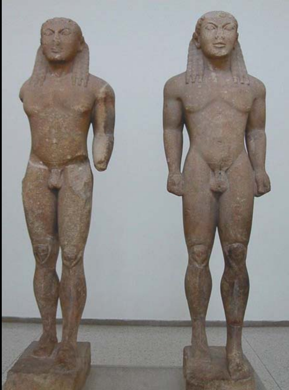
Kleobis y Bitón