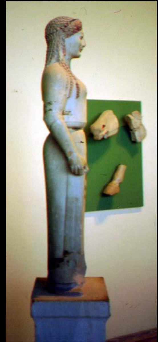
LA KHORÉ DEL PEPLO. MÁRMOL POLICROMADO. 530 A. C.