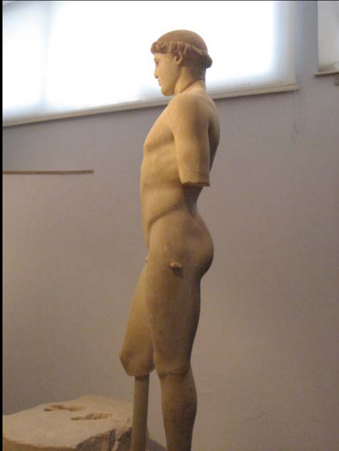
Kritios (c 480 AC) mármol (Atenas, Acrópolis Museum)