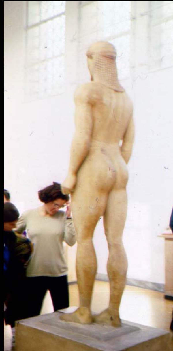
Kourós de Anavyssos (c 540-515 AC) (Atenas, National Museum) policromado (pintado) mármol