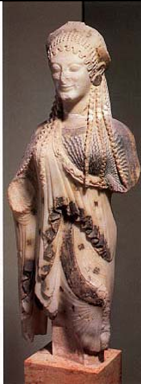
"Hera," de Samos. C. 570 - 560 AC. mármol, altura 6' 4". Kore con peplo dórico. C. 530 AC. mármol, altura 48". Kore, de Chios (?). C. 520 AC. mármol, altura 21 7/8".