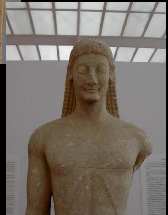
KOURÓS (M.A.N. Atenas)