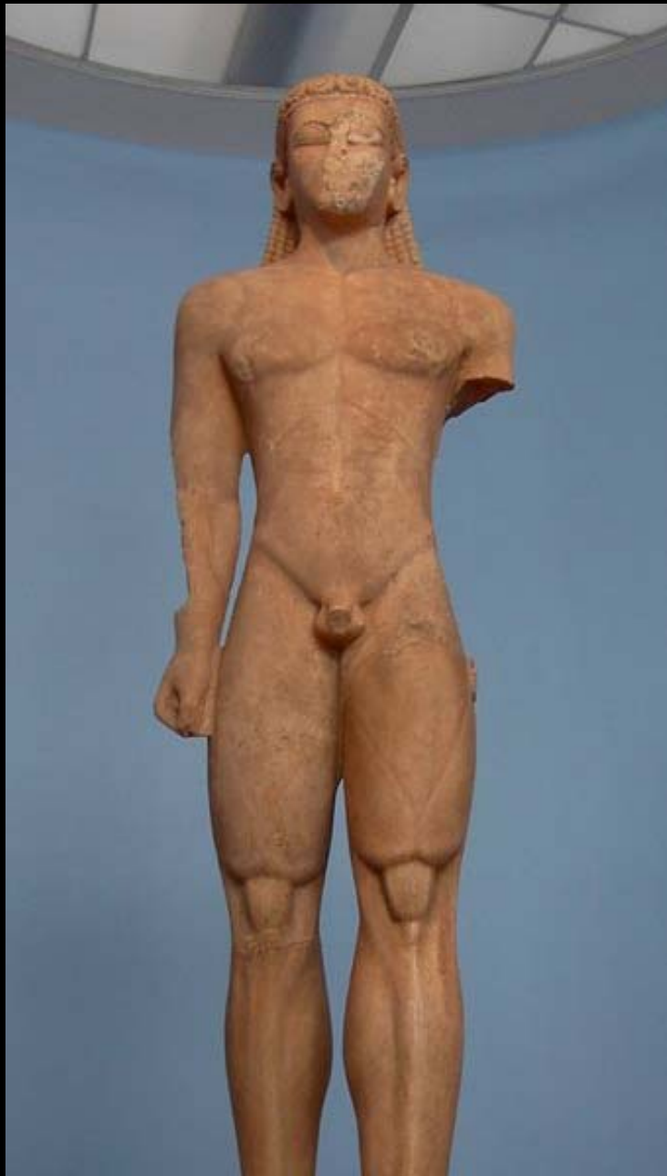
KOURÓS DEL MUSEO ARQUEOLÓGICO NACIONAL DE ATENAS