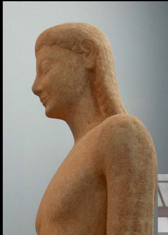
VISTA LATERAL DEL KOURÓS DEL MUSEO ARQUEOLÓGICO DE TEBAS