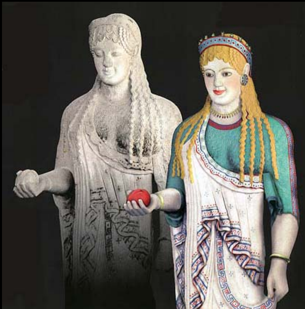
Recreación de una “Koré” policromada